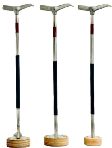
MK250 FLEX MK250 MK130

Za poklopce ventila, hidranata i kućnih priključaka