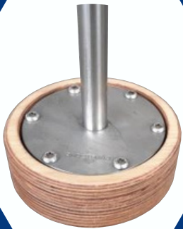
Drveni zaštitni poklopac